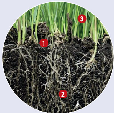
mit aktiviertem Leonardit